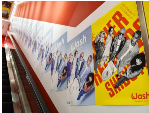
※1-2 階エスカレーター