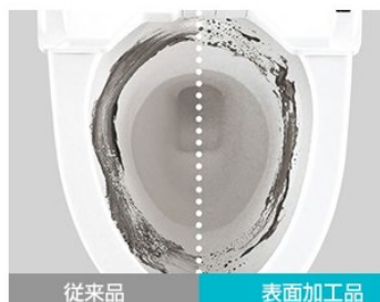
汚れの付きにくい 表面加工技術